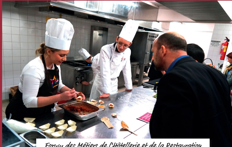
Forum des Métiers de l'Hôtellerie et de la Restauration