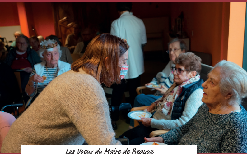
Les Voeux du Maire de Beaune