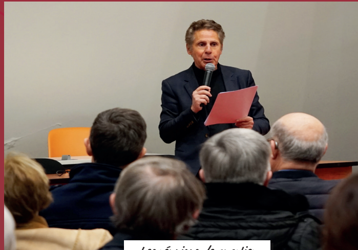
Les réunions de quartier