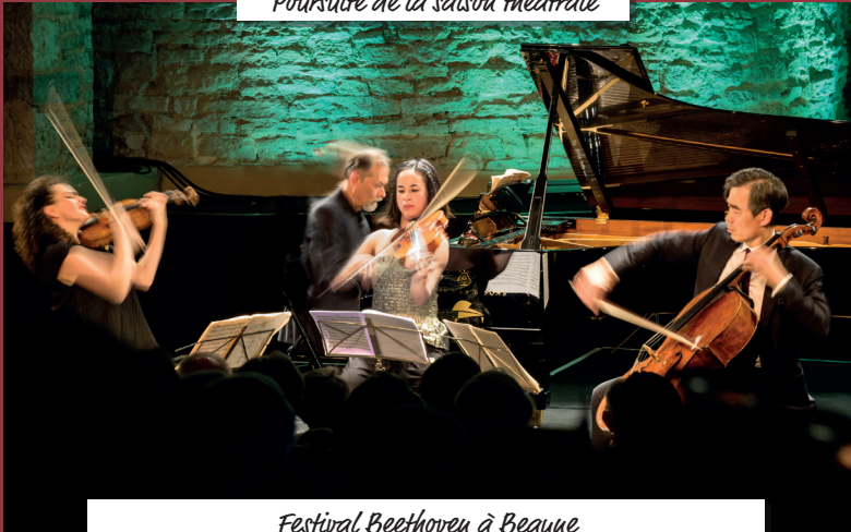
Festival Beethoven à Beaune