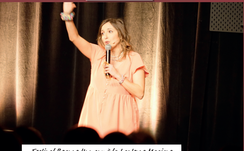
Festival Beaune Humour à la Lanterne Magique