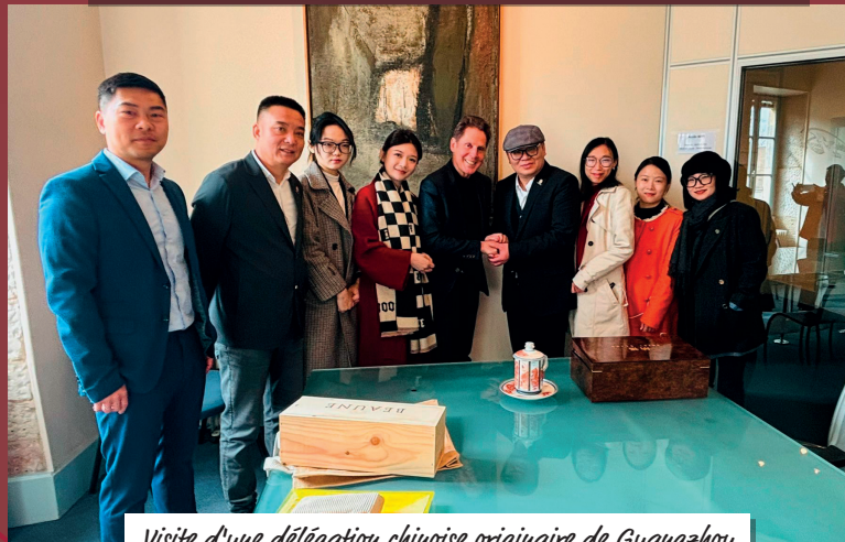
Visite d'une délégation chinoise originaire de Guangzhou