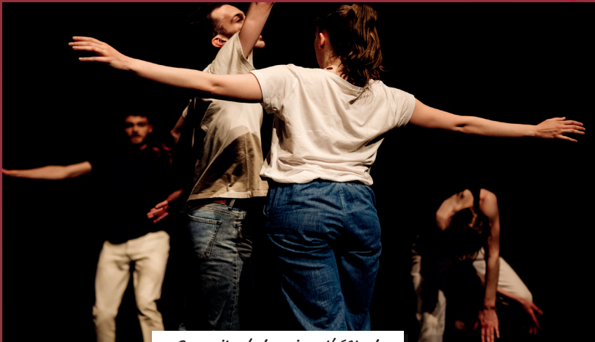
Poursuite de la saison théâtrale