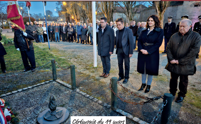
Cérémonie du 19 mars