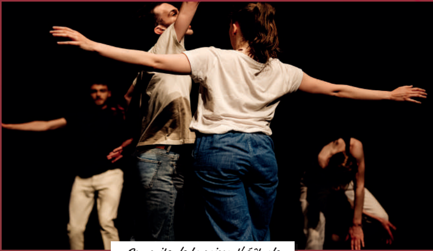
Poursuite de la saison théâtrale