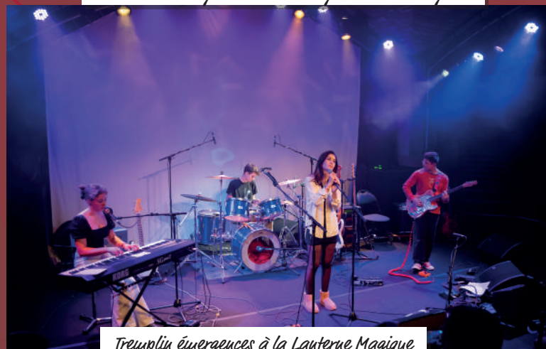
Treuplin Émergences à la Lanterne Magique