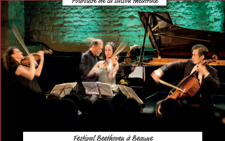
Festival Beethoven à Beaune