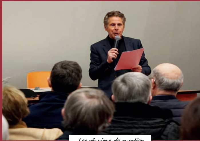
Les réunions de quartier