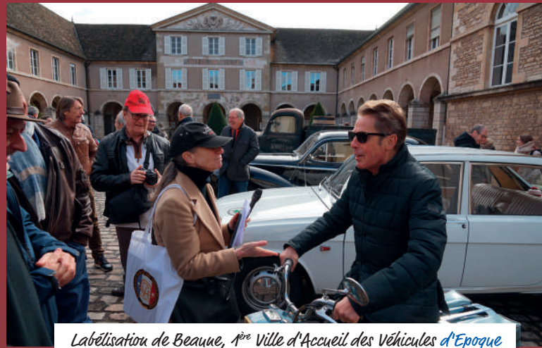
Labélisation de Beaune, 1 re Ville d'Accueil des Véhicules d'Époque