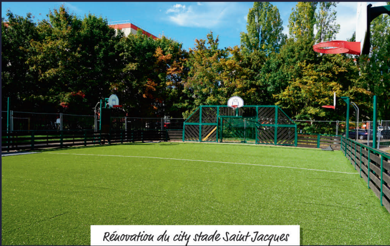
Rénovation du city stade Saint-Jacques