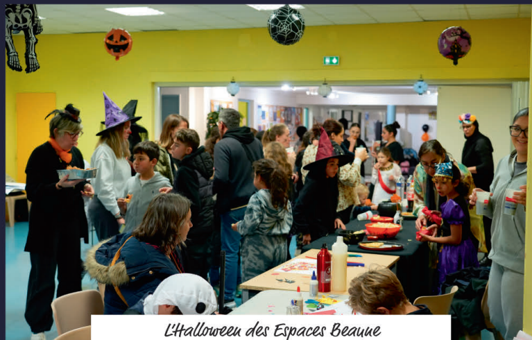
L'Halloween des Espaces Beaune