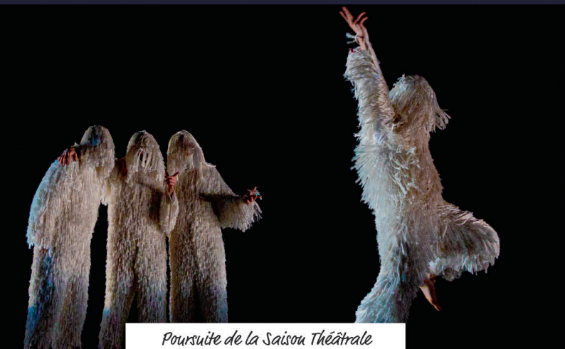
Poursuite de la Saison Théâtrale