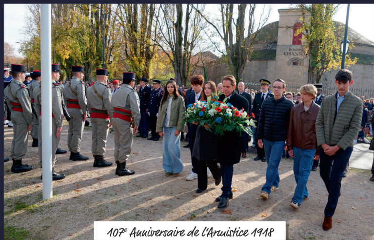
107 e Anniversaire de l'Armistice 1918