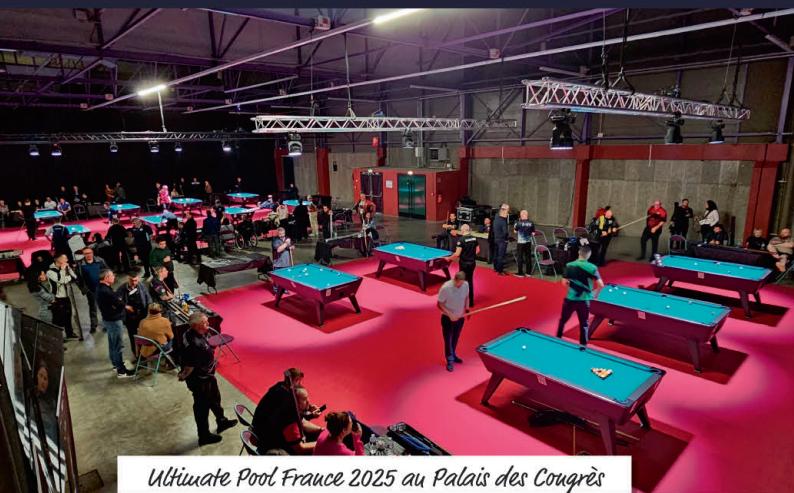
Ultimate Pool France 2025 au Palais des Congrès