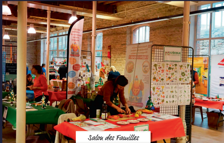
Salon des Familles