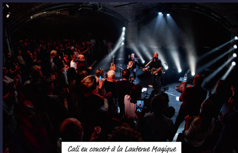
Cali en concert à la Lanterne Magique