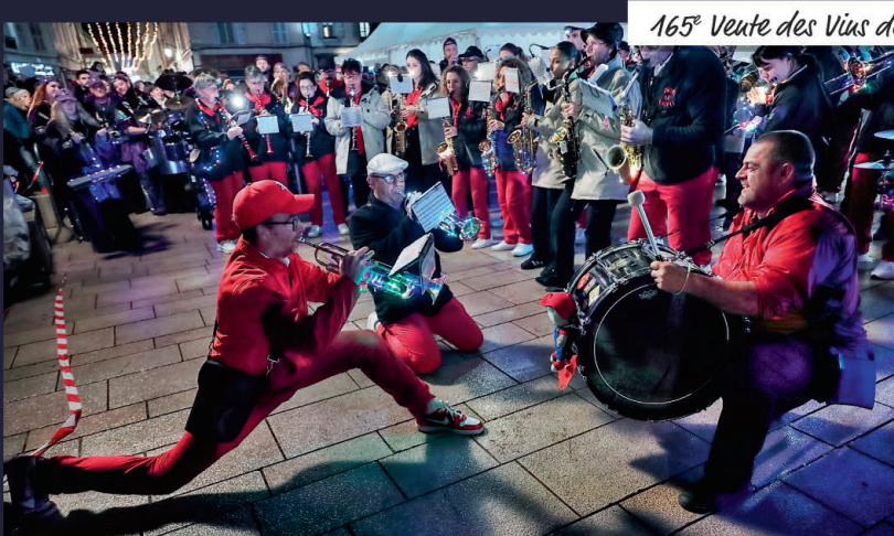
165 e Vente des Vins des Hospices de Beauvais