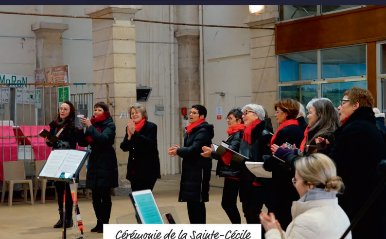
Cérémonie de la Sainte-Cécile