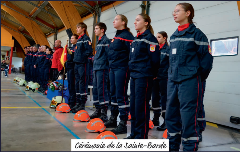
Cérémonie de la Sainte-Barbe