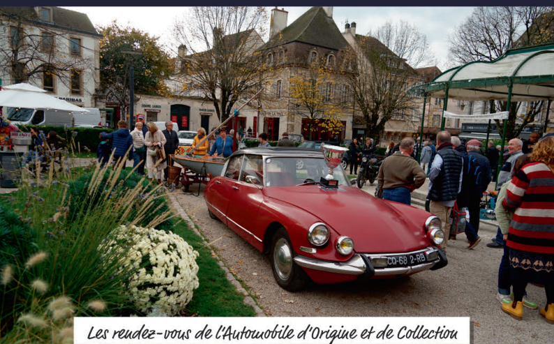
Les rendez-vous de l'Automobile d'Origine et de Collection